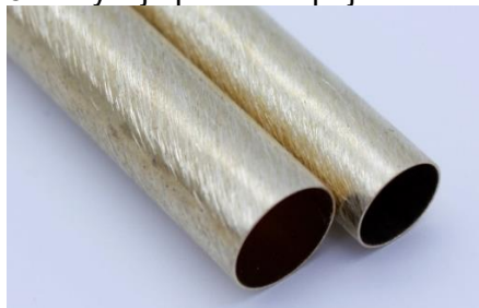
Správně obroušený povrch pro lepení

Krok 4 - Přilepte trubičky do polotovarů