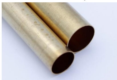
Povrch bez broušení

Krok 3 – Zdrsněte povrch trubiček před nalepením do polotovarů , brusným papírem zrnitosti 80 – 120. Křížem obrusit pod úhlem cca 45°. Zvyšuje pevnost spojení trubičky s polotovarem.