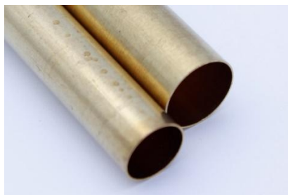
Povrch bez broušení

Krok 3 - Zdrsněte povrch trubičky před nalepením do polotovarů , brusným papírem zrnitosti 80 – 120. Křížem obrusit pod úhlem cca 45°. Zvyšuje pevnost spojení trubičky s polotovarem.