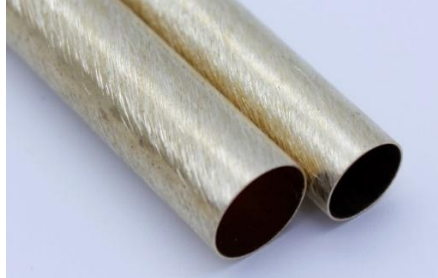
Správně obroušený povrch pro lepení

Krok 4 - Přilepte trubičku do polotovaru