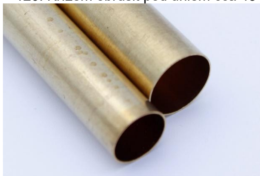
Povrch bez broušení

Krok 3 – Zdrsněte povrch trubiček před nalepením do polotovarů, brusným papírem zrnitosti 80 – 120. Křížem obrusit pod úhlem cca 45°. Zvyšuje pevnost spojení trubičky s polotovarem.