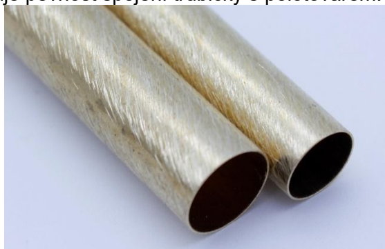
Správně obroušený povrch pro lepení

Krok 4 - Přilepte trubičky do polotovarů